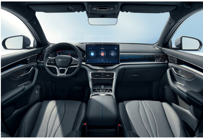
Kunstlæder i sort