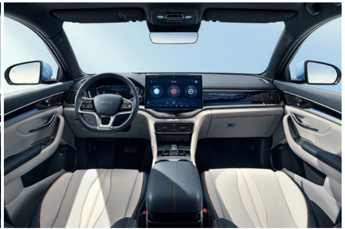
Kunstlæder i beige/grå